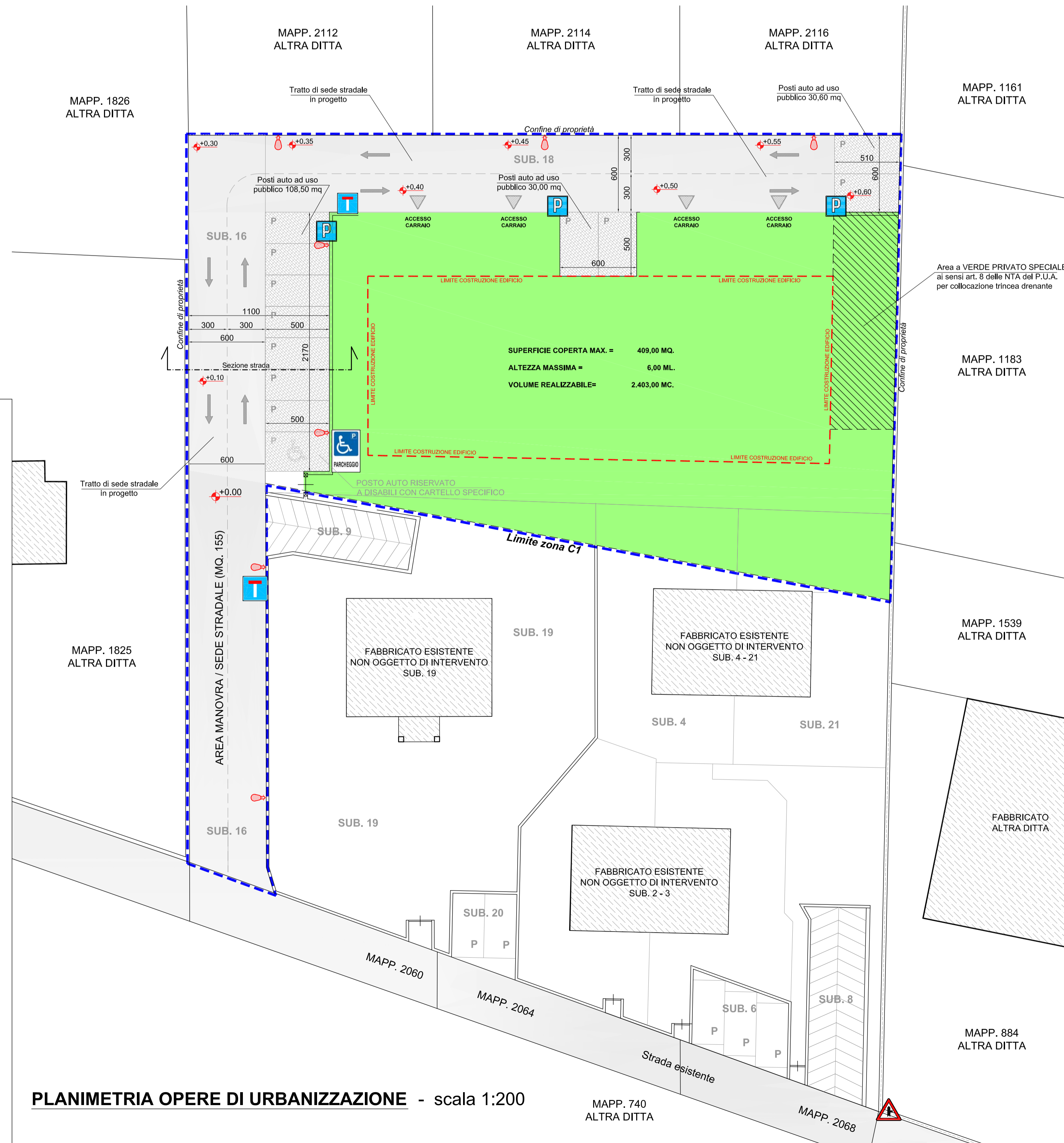
PLANIMETRIA OPERE DI URBANIZZAZIONE - scala 1:200

Comune di Arzignano - Provincia di Vicenza